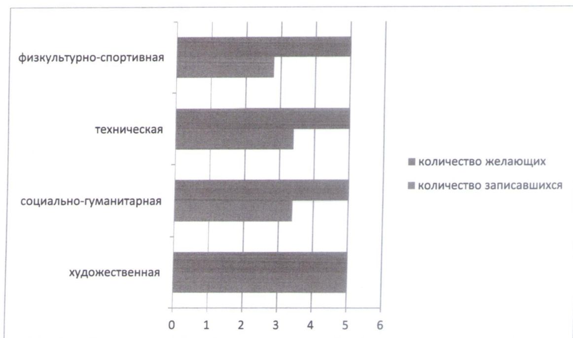
Диаграмма показывает, что по физкультурно-спортивной, технической и социально-гуманитарной направленности выбор обучающихся удовлетворен на 50%, 63%, 64% соответственно. Поэтому, перед учреждением стоит большая задача- поиск кадровых, материальных, финансовых возможностей для удовлетворения спроса обучающихся, особенно подросткового и старшего школьного возраста, в новых дополнительных общеобразовательных программах.